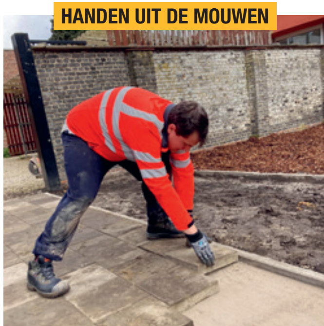
HANDEN UIT DE MOUWEN