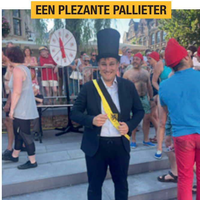
EEN PLEZANTE PALLIETER

Iedere job is even belangrijk. Een burgemeester die wil weten hoe onze stad echt draait moet ook in andermans werkschoenen staan.