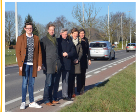
Binnenkort verleden tijd: het smalle fietsstrookje tussen Jut en Lier