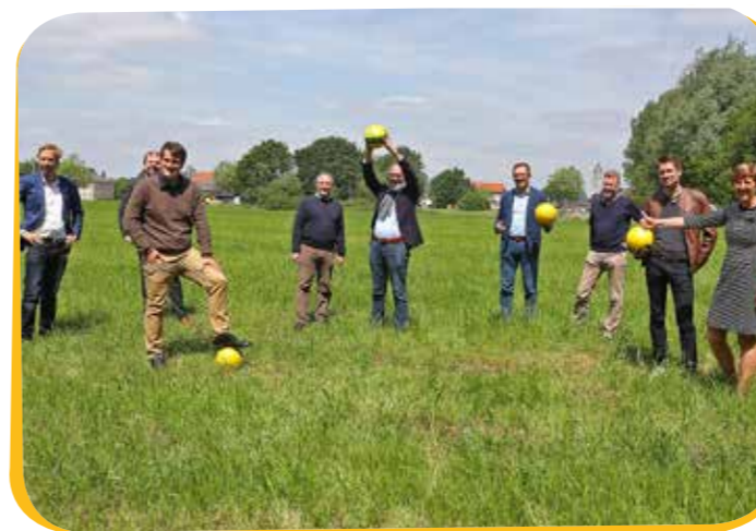
N-VA gaat voor een stedelijk jeugdvoetbalcomplex op de Hoge Velden en een kunstgrasveld in Hooikt. Meer daarover in onze volgende editie!