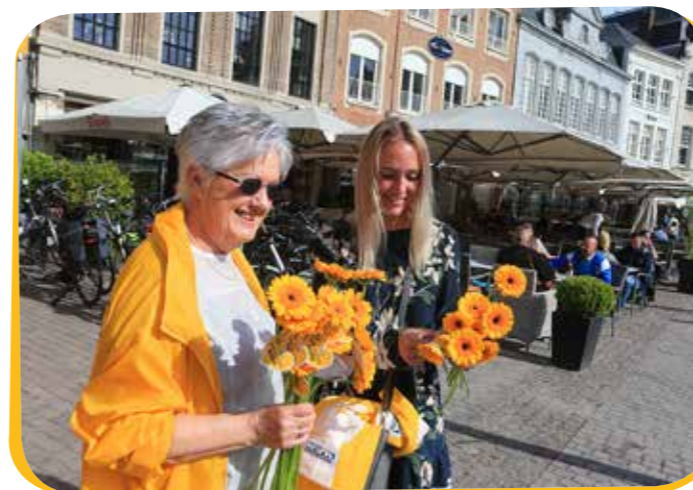
Op 12 mei fleurde N-VA de zaterdagmarkt op met onze jaarlijkse Moederdagactie.