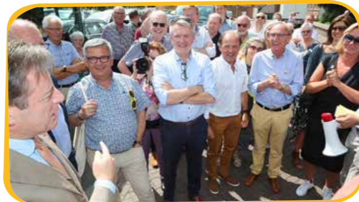
Bart De Wever bezocht onze stad met heel wat N-VA-kopstukken. De Lierenaren verwelkomden hen hartelijk!