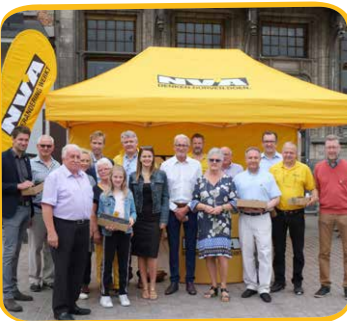
Op Vaderdag deelde N-VA leuke gadgets uit op de zaterdagmarkt.