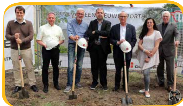
De eerste schep ging in de grond voor de nieuwe stedelijke sporthal aan het Atheneum.