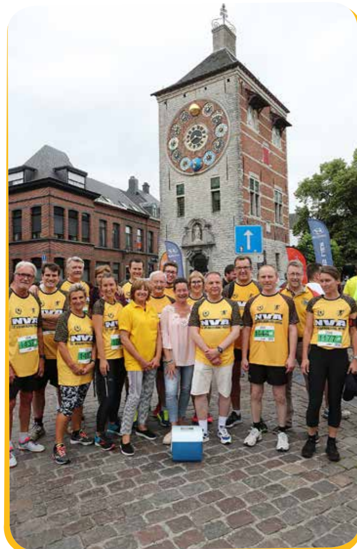
Onze N-VA-ploeg zette haar beste beentje voor op de Pallieterjogging